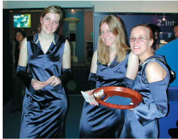
Die Wegold-Girls, gewandet in extra entworfenen Satinroben – natürlich in den Firmenfarben – servierten Cocktails ...

Begleitet von vielfältigen Serviceangeboten und individueller Betreuung stellt DeguDent dem Kunden noch breitere Material- und Therapiekonzepte zur Verfügung: EM-Dentallegierungen, CAM-Systeme, Press- und Verblendkeramiken, Konstruktionselemente, Geräte, Verbrauchsmaterialien, Konfektionszähne und Prothesenkunststoffe – das komplette Spektrum kommt aus einer Hand.