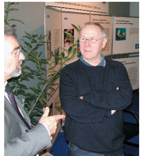
Armin Maiwald, „Maus“-Fans bestens bekannt, der Regisseur des Zahnfilms.

Nach dem Publikums-Event der letzten IDS, das nicht den gewünschten Erfolg hatte, modifizierte proDente, die Öffentlichkeitsinitiative der Dentalverbände, ihren Messeauftritt. Auf dem IDS-Stand hatte ein kleiner Spielfilm Premiere. Thema: natürlich Zähne. Regie führte Armin Maiwald, einer der Miterfinder der „Sendung mit der Maus“. Der Film ist zur Präsentation in Zahnarztpraxen und auf kleinen Messen gedacht. Erzählt wird kurzweilig die Geschichte eines Vaters, der beim Sport einen Zahn verliert. Armin Maiwald, der bestens versteht, ein Thema gleichsam informativ wie unterhaltsam aufzubereiten, war dafür sicher die richtige Wahl. Zum Zahnarzt geht der TV-Mann nach eigener Aussage nicht gerade