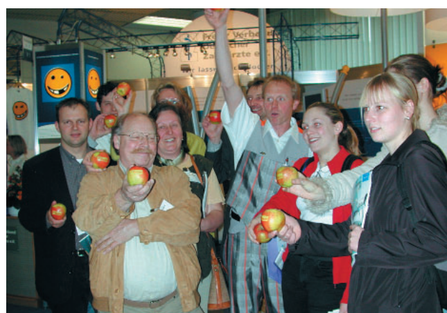
Äpfel zählen, darum ging's im Wettbewerb. Auch zum Essen waren etliche Äpfel da. Schließlich ist Obst ja sooo gesund ...

gern, aber eine Zahnarzt-Phobie habe er nicht. Den Film kann man im Internet unter www.prodente.de bestellen.