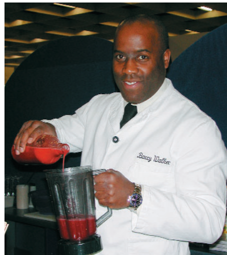
... die von Bar-Profi Barry Walker gemixt wurden.

Mit dem neuen Rüttler von Wegold bleibt die Tischplatte erschütterungsfrei.